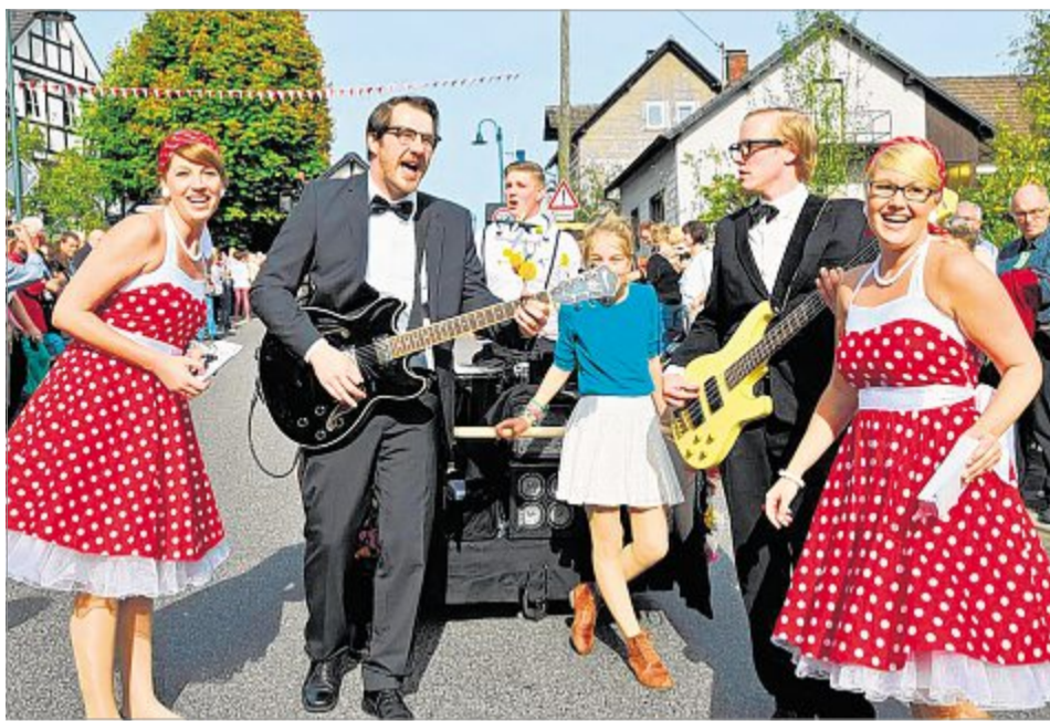
„Liebeskummer lohnt sich nicht, mein Darling“: Die „Wölmischen Musikanten“ setzten einen Kontrapunkt zu den Blaskapellen im Zug.