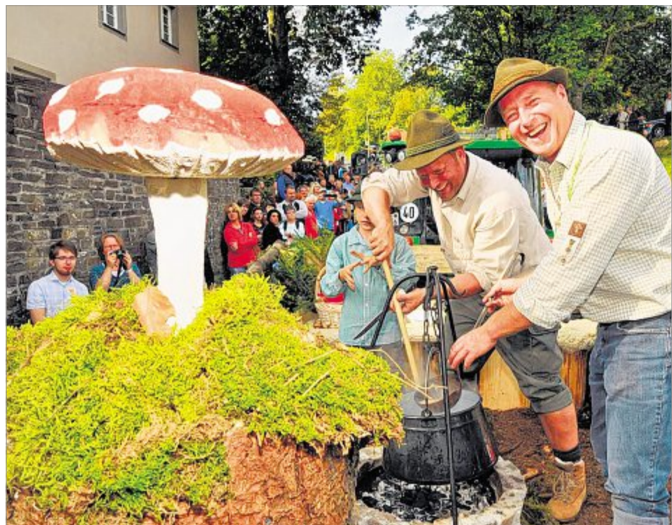
Leckere Pilzsuppe hatten die Dedemejer Makowelser im Kessel. Bleibt ihnen nur zu wünschen, dass keiner den Fliegenpilz reingeschnippelt hat.