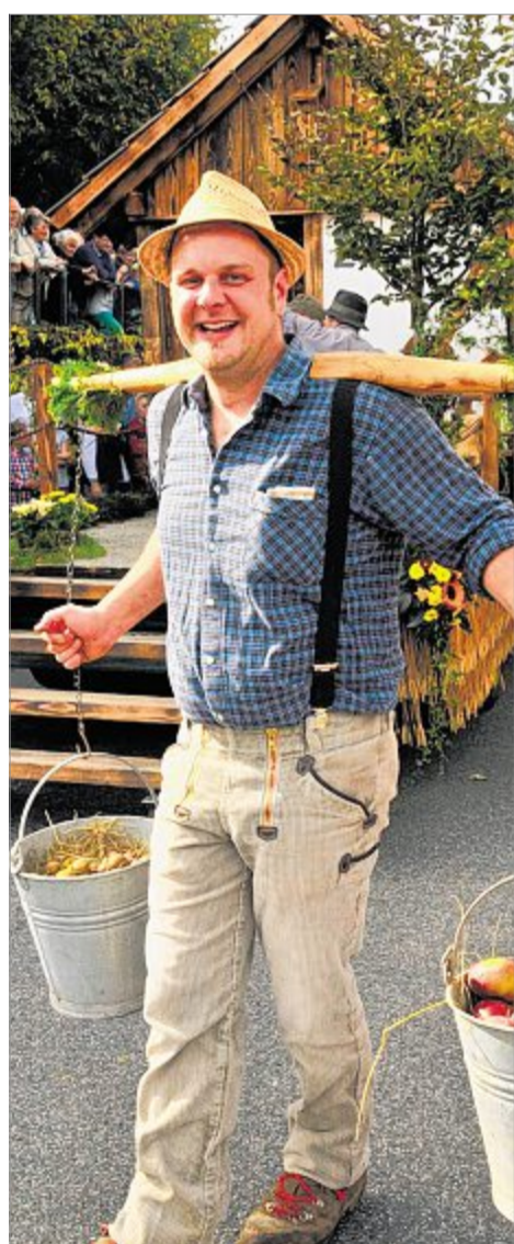
Vertauschte Welt: Mit einem Lächeln auf den Lippen hat dieser junge Mann von der Wildenburger Erntejugend die schweren Eimer durchs Dorf geschleppt, während sich die kleinen Schneemänner mit eher skeptischer Miene haben kutschieren lassen.