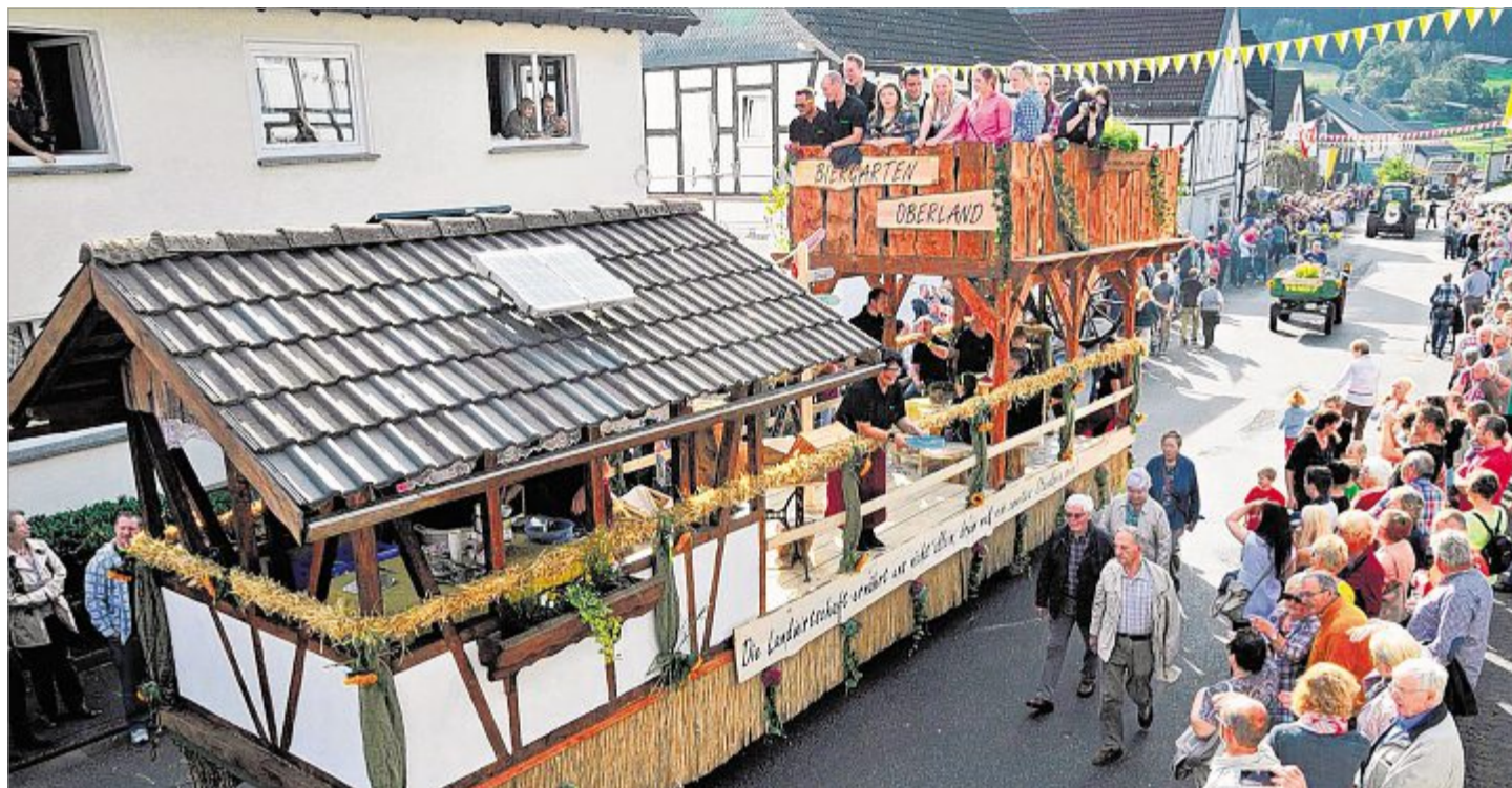
Das Dach solide gedeckt, der Balkon stabil: Was in den Scheunen des Wildenburger Landes in den letzten Wochen und Monaten gezimmert worden ist, dürfte auch die Handwerker unter den Zuschauern beeindruckt haben..