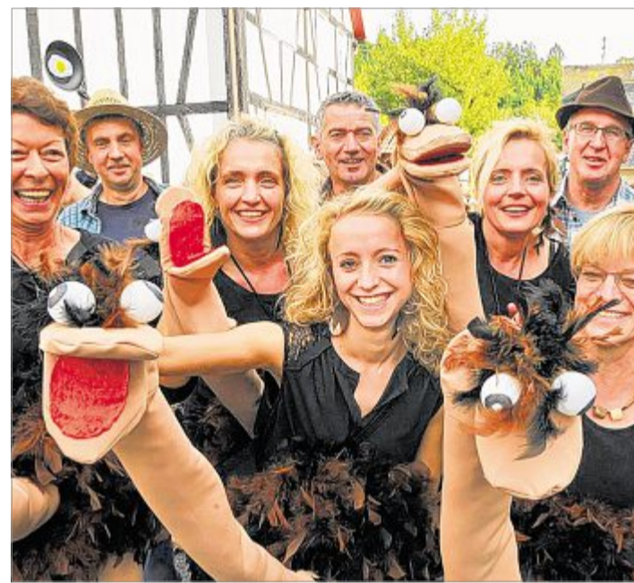
Am Wasserstollen gibt es jetzt eine deutlich lukrativere Strauflerfarm.