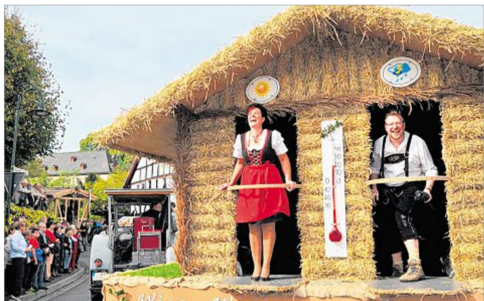
Liebe DJK, schöner Wagen, aber: Beim Erntedankfest braucht man weder ein Wetterhäuschen noch einen Frosch auf der Leiter: An diesem Tag scheint die Sonne, ganz sicher.